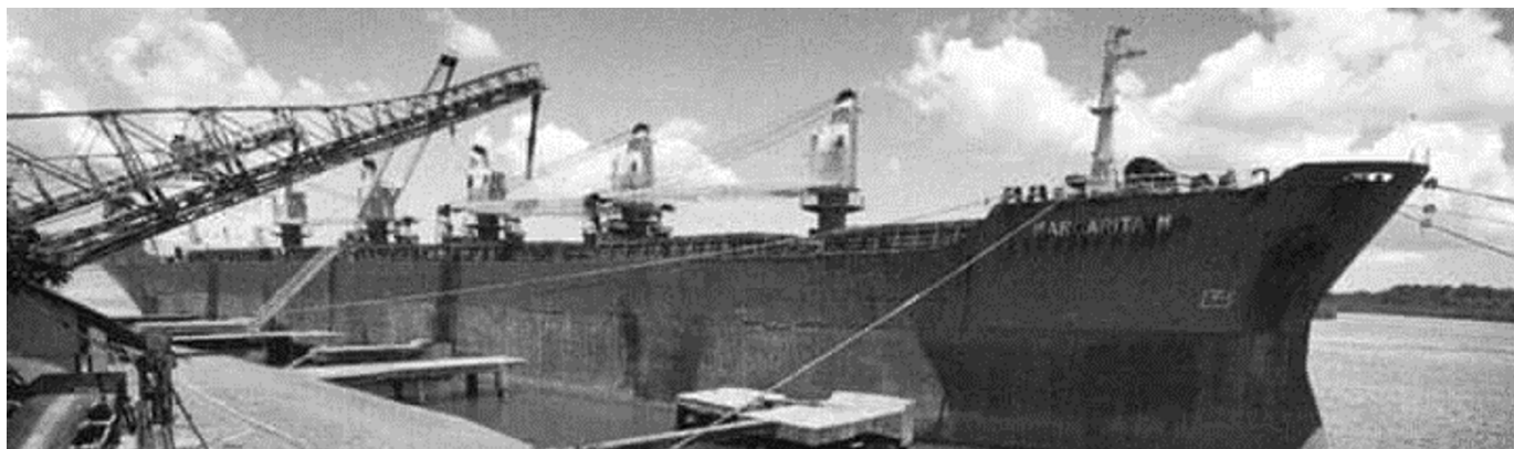
Pelabuhan Ekspor Bauksit Kijang Milik P.N. T.B.I.

Pada awalnya struktur organisasi P.N. T.B.I. adalah sebagai berikut: pucuk pimpinan dijabat oleh seorang Direktur selanjutnya ada Sekretaris Perusahaan. Kemudian ada empat Biro : Biro I (Keuangan), Biro II (Umum), Biro III (Teknik) dan Biro IV (Tambang). Biro III dan IV langsung di bawah Direktur, sedangkan Biro I dan II di bawah Sekretaris Perusahaan. Waktu itu Biro Keuangan (Biro I) lebih berperan dari Biro Tambang (Biro IV). Di awal tahun 1966 menjelang konfrontasi berakhir, BPU Pertambun merubah struktur organisasi dengan menambah formasi Direktur Muda, yang sebetulnya tidak ada manfaatnya tetapi justru akan merusak tatanan