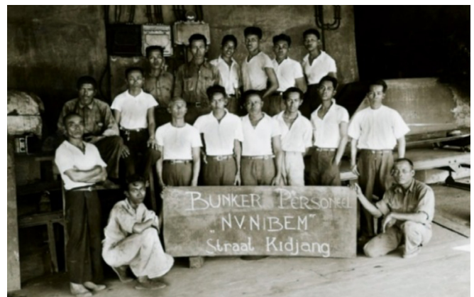
Karyawan N.V. NIBEM