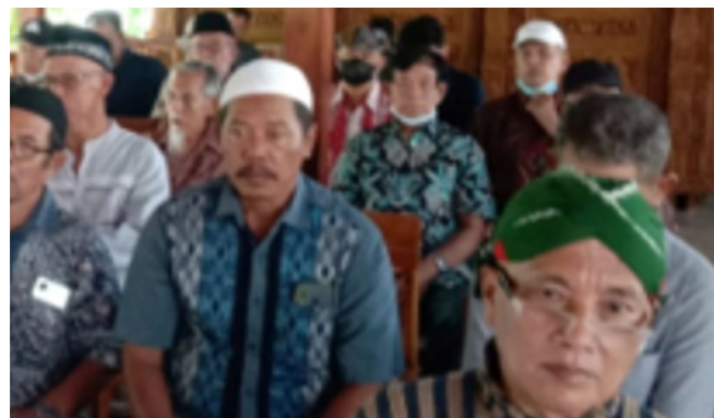
Foto kenang-kenangan anggota HC Yogyakarta dengan Management Himpunantam Pusat, Beberapa tamu yang hadir, salam-salaman, dan pembagian sembako