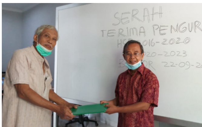
Serahterima Pengurus HA-C Pongkor 2020-2023 secara simbolis