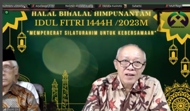
Sambutan Ketua HA-P