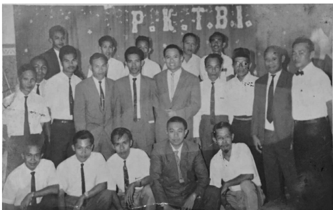
Pengurus dan Anggota Persatuan Karyawan Tambang Bauksit Indonesia (P.K.T.B.I.) Sebahagian Sudah Almarhum

Rawa-rawa di daerah Sungai Datuk sebelum ada jalan produksi, pada awalnya juga hutan mangrove. Pohon mangrove berfungsi merubah CO 2 menjadi O 2 melalui proses foto sintesa sehingga menghasilkan udara segar. Komplek perumahan karyawan (emplasemen) terlihat rapih dan bersih. Taman di halaman rumah para karyawan P.N. T.B.I. dipercantik dengan botol-botol bekas minuman yang disusun menjadi deretan pagar tanaman hias. Di Pulau Jawa, karena masyarakatnya susah maka botol-botol kosong dijual ke tukang loak untuk menambah biaya belanja harian.