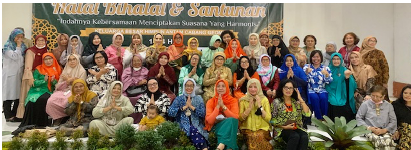
Suasana HBH HA-C Geomin