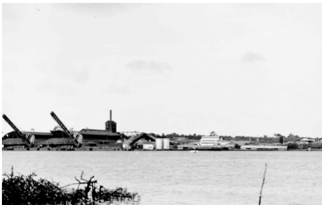
Pelabuhan Ekspor N.V NIBEM Yang Diekspor berupa Bauksit Kering