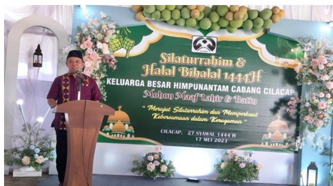
Sambutan dari Ketua HA-C Cilacap dan HA-P