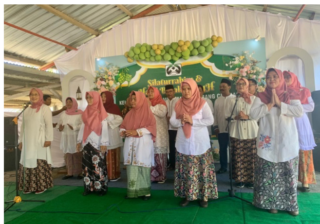
Tampilan Koor dari Ranting

Suatu hal yang berkesan dari ber- HBH di beberapa HA-C ini adalah terlihatnya suasana kegembiraan, keakraban/kerukunan, dan kebersamaan yang diperlihatkan oleh para pensiunan karena merasa bahwa para pensiunan terikat dalam suatu keluarga besar yang bernama HIMPUNANTAM . Partisipasi dari para pensiunan sangat besar dalam usaha menyambung silaturahmi, ini terlihat pada tingkat kehadiran yang sangat tinggi dari para