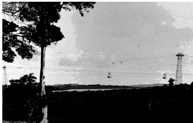
Kabelban Menghubungkan Kijang – P. Angkut – P. Koyang

Di Tanjung Pinang celana Blue Jean, jaket Levis, baju kaos Banlon dan pleated skirt yang kala itu lagi trending di kalangan remaja, harganya setengah dari harga di Jakarta. Mahasiswa I.T.B. yang kerja praktek dan tugas akhir di P.N. T.B.I. menceritakan bahwa pertama kali datang di Kijang, sebelum masuk mess Pesanggrahan yang terletak di tepi laut, mereka langsung ke pasar dulu untuk membeli under wear merk Hing yang tidak terbeli di Pulau Jawa. Kemudian under wear lama yang terbuat dari kain katun hasil jahitan sendiri diikat menyatu dengan batu pemberat dan dilempar ke laut di depan mess. Pulang dari Kijang para mahasiswa biasanya membawa oleh-oleh pemberian karyawan dan perusahaan berupa sabun Camay, pasta gigi Colgate, Ovaltine, Milo, Lipton Tea, rokok Triple Five, Dunhill, tembakau Warning dan lain-lain. Barang-barang tersebut berasal dari Singapura. Ada yang pulang dengan membawa kompor minyak tanah Butterfly yang waktu itu harganya relatif mahal, yang didapat dari hasil permainan Toto (permainan khas Kijang). Rata-rata semua karyawan P.N. T.B.I. mempunyai sepeda motor Honda dan banyak yang memiliki mobil pribadi. Waktu itu di Bandung para karyawan Direktorat Geologi masih banyak yang bersepeda. Karyawan Direktorat Geologi Bandung yang ditugaskan ke P.N. T.B.I. Kijang pulang ke Bandung pasti membawa sepeda motor Honda 70 cc.