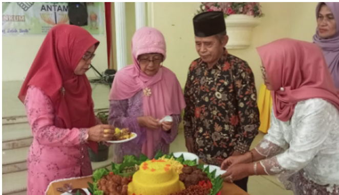
Acara pemotongan tumpeng sebagai rasa syukur terhadap Allah SWT atas karunia-Nya yang diberikan kepada kita semua.

ALHAMDULILLAH HIROBBIL AALAMIIN, HA-C Kijang telah melaksanakan HALAL BI HALAL 1444 H sebanyak 2 kali, yaitu pada 30 April 2023 dan 16 Mei 2023. HBH tersebut masing-masing untuk HA-C Kijang dan Kerukunan Istri Pensiunan Antam (KERISPENA) Kijang, keduanya bertempat di Gedung Wisma Karya Antam Kijang. Dalam acara HBH KERISPENA sekaligus dirangkaikan dengan HUT ke-16 KERISPENA bersama generasi penerus Antam.