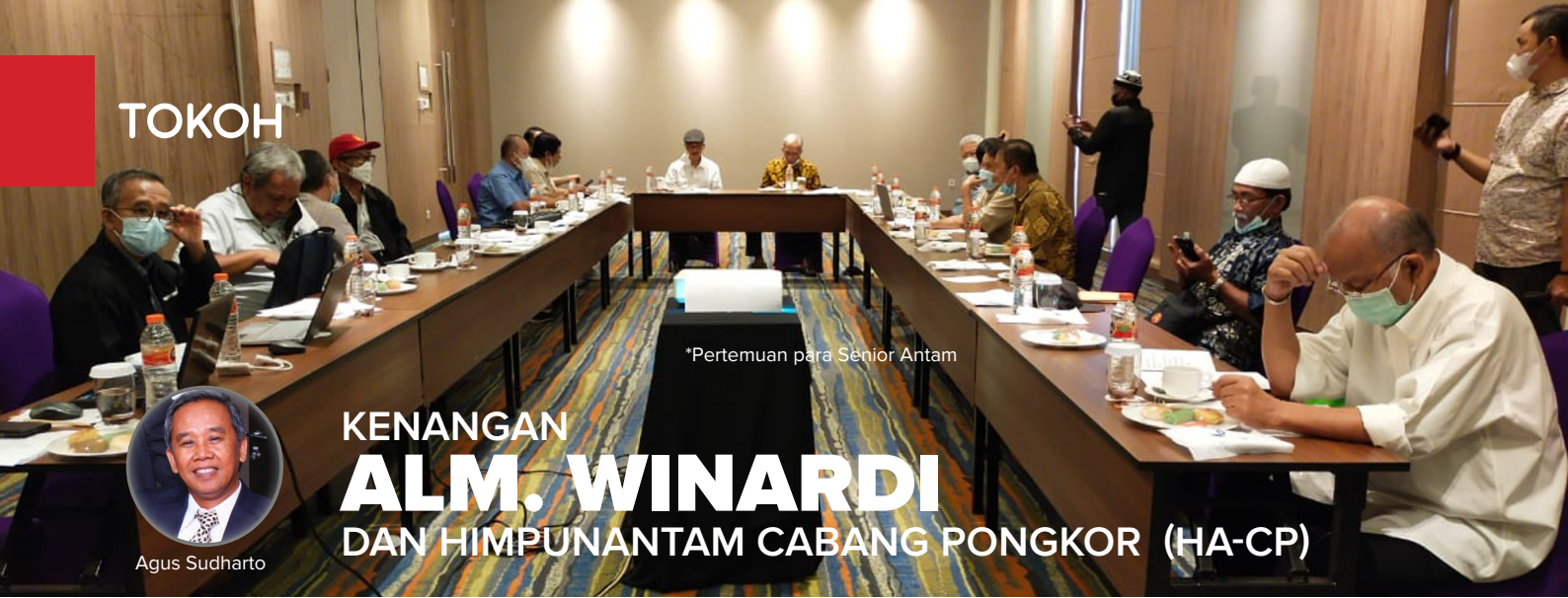
*Pertemuan para Senior Antam