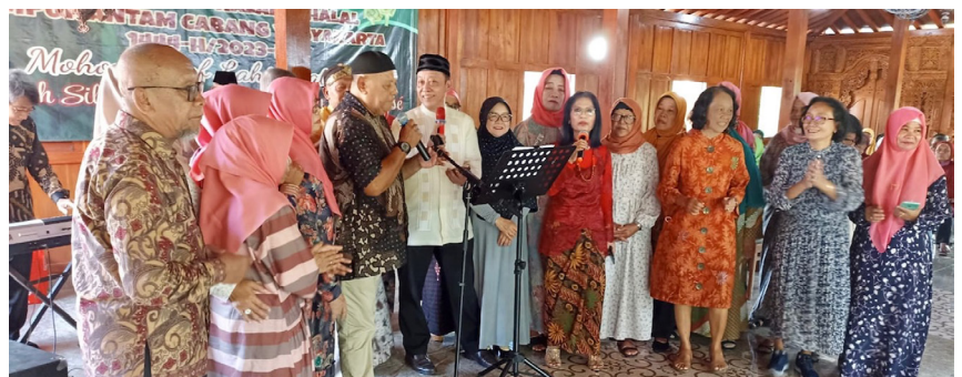
Suasana HBH HA-C Yogya