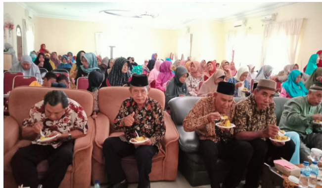
Bincang-bincang sambil menikmati hidangan.

Kedua HBH tersebut berjalan lancar dan diharapkan dapat meningkatkan kerukunan dan silaturahmi antar sesama pensiunan. Pada kesempatan itu HA-C Kijang mencoba memperdengarkan lagu mars yang akan diusulkan sebagai calon MARS HIMPUNANTAM. Mars ini mungkin masih ada kekurangannya, oleh sebab itu sangat diperlukan masukan dari sesama pensiunan untuk kesempurnaan lirik dan nada.