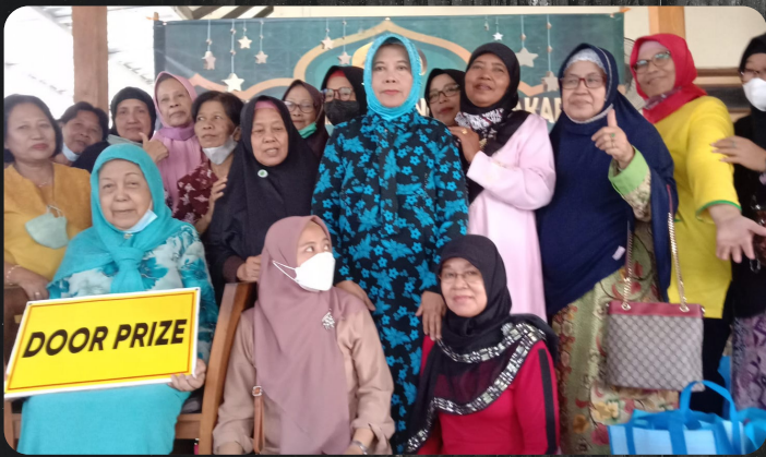
Silaturahmi & Arisan Bulanan serta Halal Bihalal HC Yogyakarta di RM Pondok Bakaran, Giwangan Yogyakarta