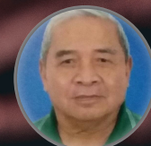
Drs. Nuriaman NPP 0098