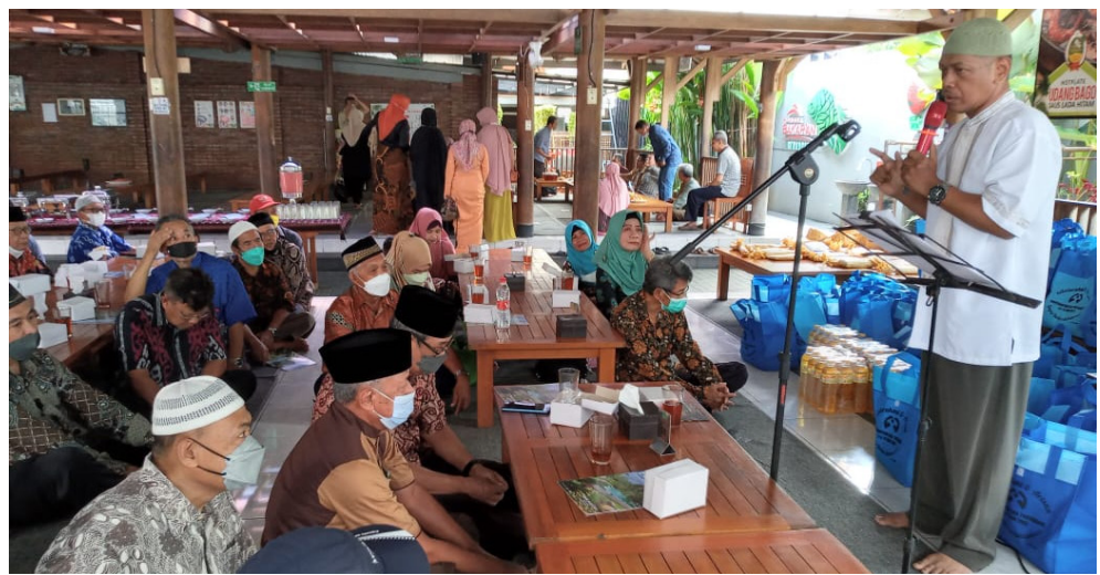
Menyimak tausiah Hikmah HBH