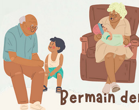
Bermain dengan CUCU