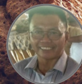
Hazaiwar, SE, Ak.